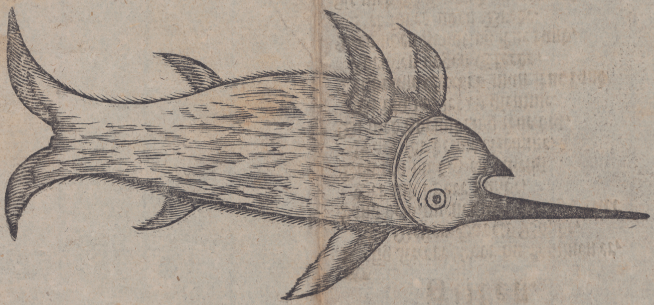
Stiftning af den forunderlige Fisk kaldet: THENNIN.

Sifrens biele længe fra det bedste af Ræbbet, ud til det bedste af Rumpen er Sifren og en halv Ellen, 3 1/2 + Sommer; En Ellen i Bredden. Zuffellen af Statten er som et stort fedt Svin. Det gav og Zuffen for som den første Aron-Saler mand gav fæst. Ræddet er sigesom fæst Siff, og Siffen er uden Siffel sidet sigesom inden i.